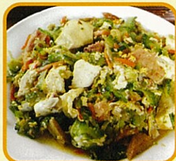
ゴーヤチャンプルー