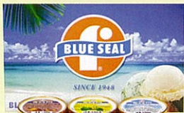
ブルーシール アイスクリーム

会場内では沖縄物産販売やアーティストCD、雑貨などをたくさんご用意しています。屋台コーナーでは沖縄の定番フード「ソーキそば」「ゴーヤチャンプルー」などもりだくさん。