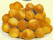
さーたー あんだぎー