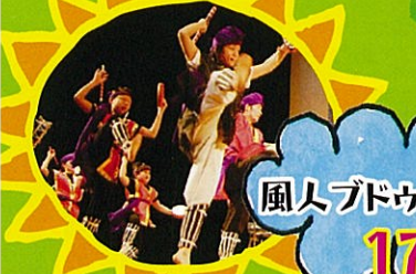
風人ブドウり太鼓 17日・18日